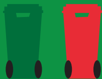
CARRELLATI VERDI E ROSSI

RICHIESTA ATTREZZATURE IN COMODATO D'USO