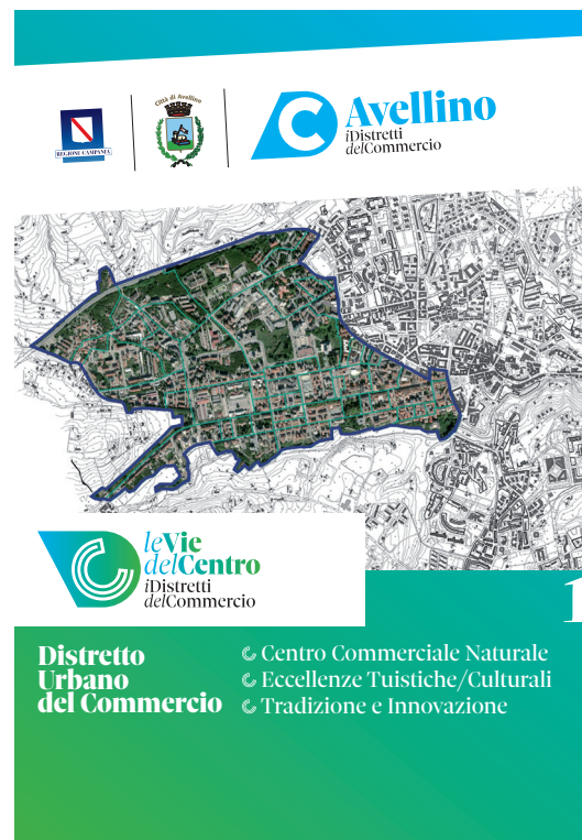
Manifesti 70x100 / 100x140