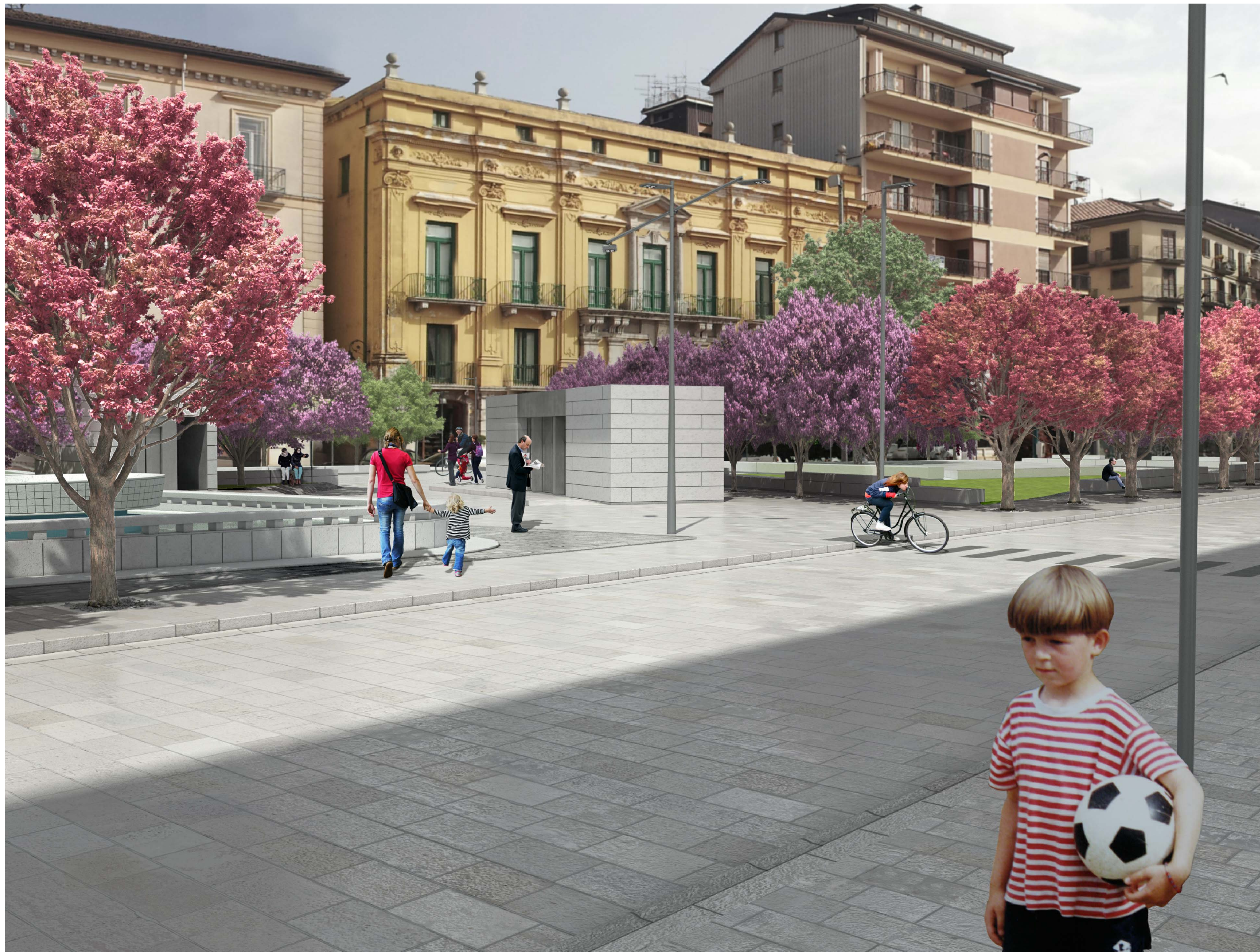
VISTA FOTOREALISTICA DAL LATO SUD