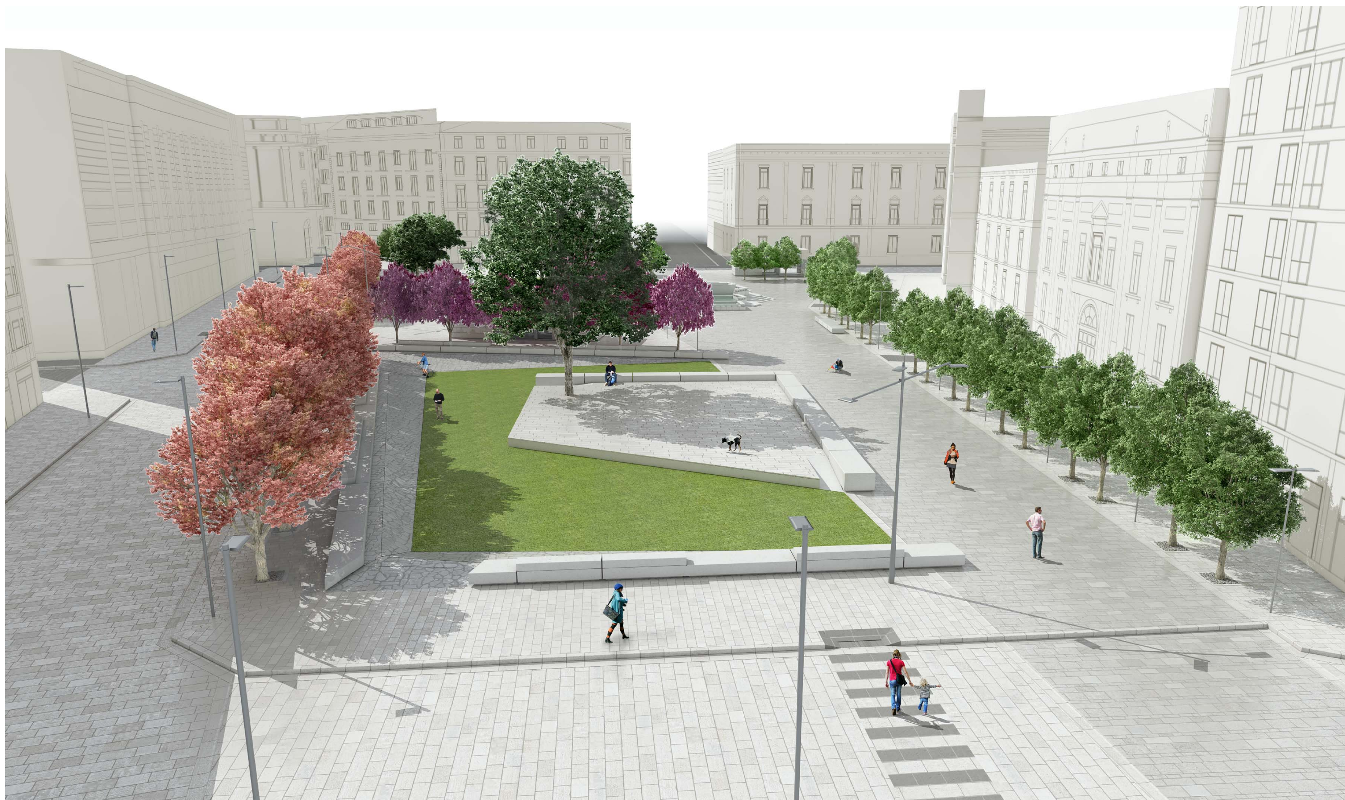
VISTA FOTOREALISTICA DA EST