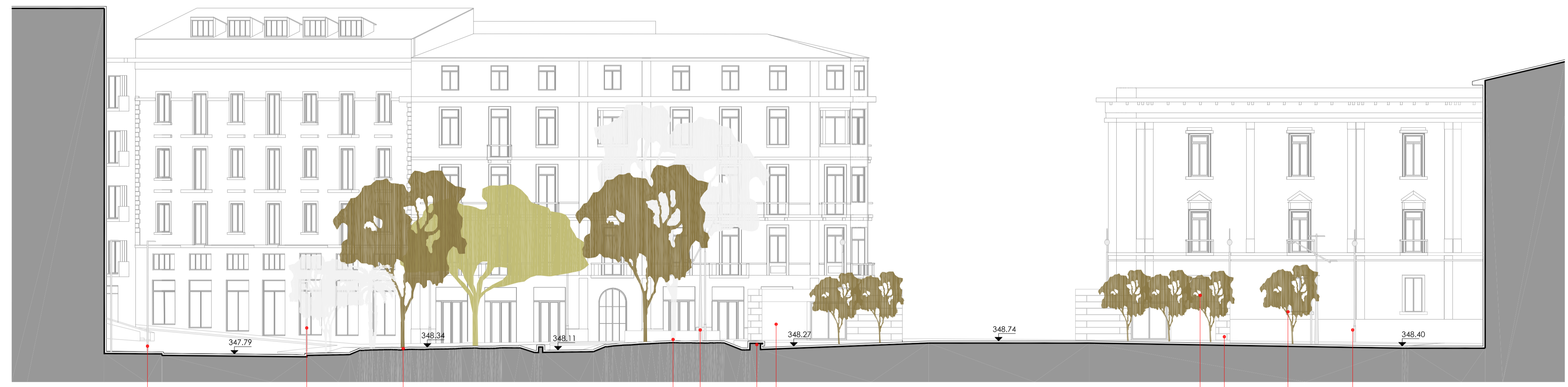
SEZIONE 1 scala 1:200