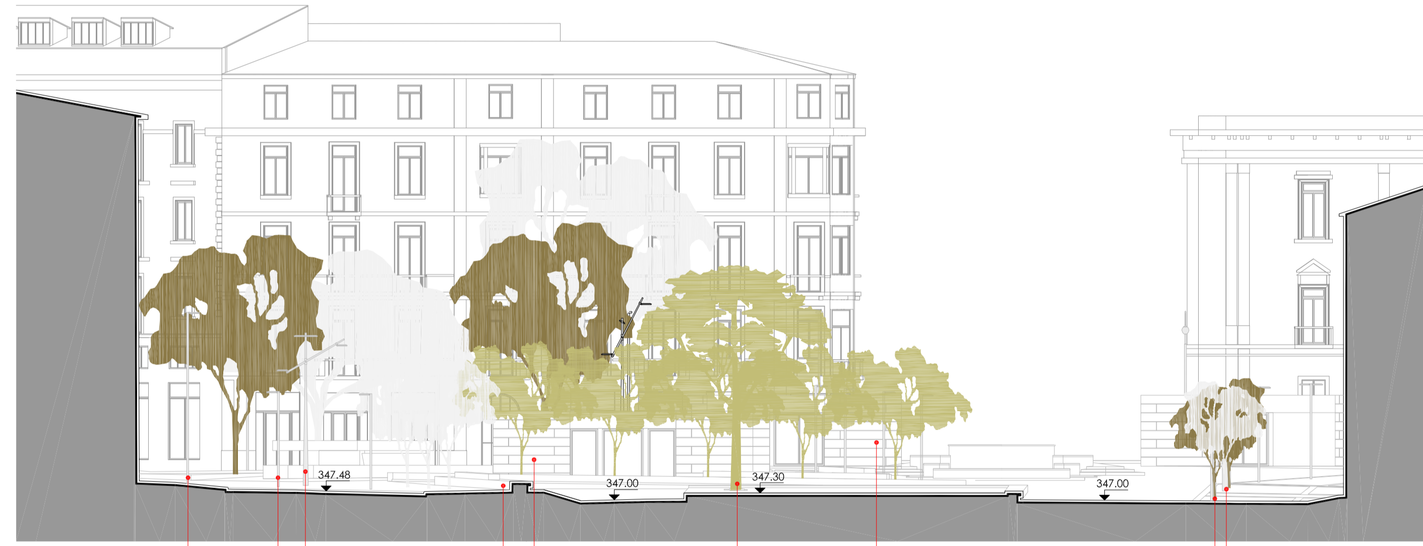
SEZIONE 2 scala 1:200