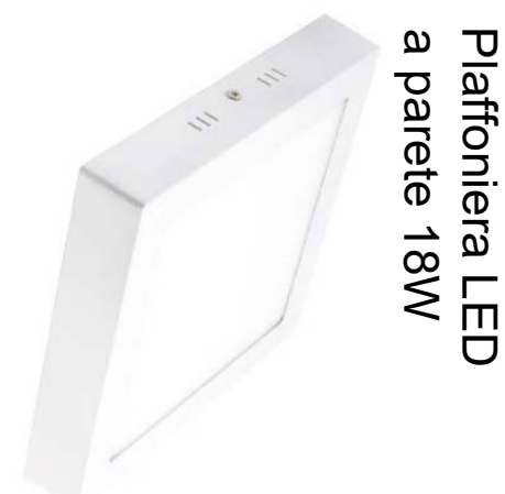
Plafoniera LED a parete 18W