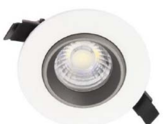
Fareto LED da 15W