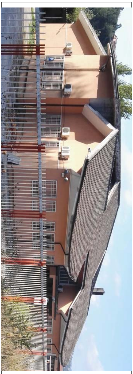
INTERVENTO DI RIQUALIFICAZIONE DELLA STRUTTURA EX CASERMA DEI VIGILI URBANI DI RIONE PARCO CUP: G17H03000130001