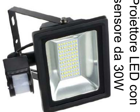
Proiettore LED con sensore da 30W