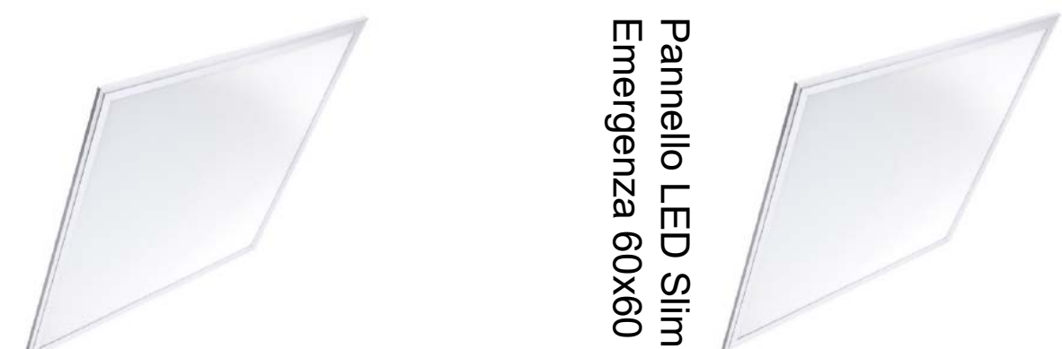
Pannello LED Slim Emergenza 60x60 40W